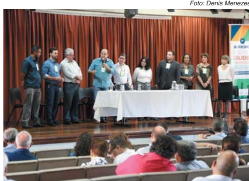
Lideranças estão em busca de soluções para o destino do lixo em cerca de 20 cidades da região

Ele se diz favorável à geração de energia a partir dos resíduos, mas alerta que em Minas a legislação não permite este tipo de situação. “Não podemos deixar de aproveitar esta matéria-prima e este potencial; nos países desenvolvidos já acontece este trabalho e um