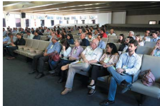
Encontro teve a participação de lideranças e a presença de prefeitos dos municípios da região da AMEG e da AMOG

dos nossos maiores trabalhos é no sentido de mudarmos a legislação, possibilitando o aproveitamento do material existente para produção de energia e estimular a reciclagem”, acrescenta.