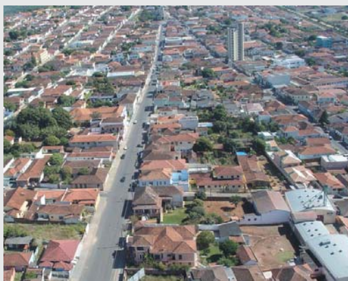
MONTE SANTO DE MINAS 198 ANOS