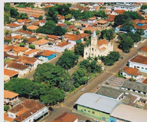
ARCEBURTO 125 ANOS

São João que reuniu comitivas de toda a região.