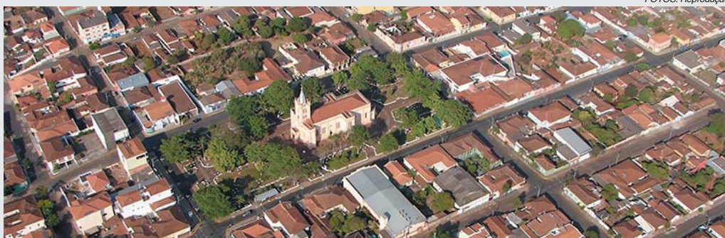
ITAMOGI 146 ANOS

A tradicional Queima do Alho também foi uma das atrações das comemorações do aniversário de Arceburgo. O evento foi realizado com grande sucesso no último sábado, 16, ao lado do Ginásio Poliesportivo. No domingo, 17, também ocorreu a cavalcada da esta de