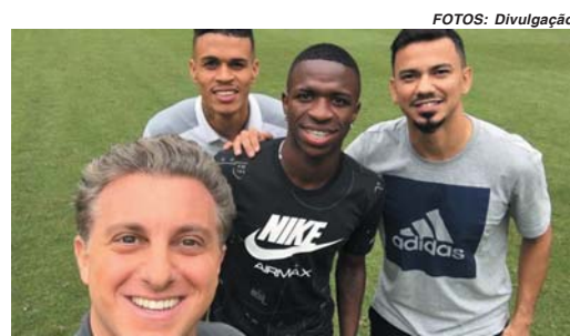
Jogador gravou quadro no programa Caldeirão, de Luciano Hulk junto com outros destaques do futebol carioca