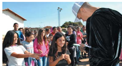
Volante do Fluminense distribuiu autógrafos e pôs para fotos na escola de Guardinha