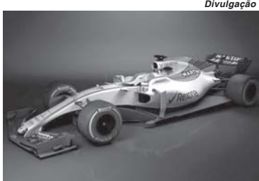
Williams saiu na frente e liberou as primeiras imagens do novo FW40

A primeira sessão será de 27 a 2 de março, e a segunda de 7 a 10, todas no Circuito de Barcelona, na Espanha. E pela complexidade do novo regulamento, os "blefes", muito comuns na pré-temporada onde as equipes procuram esconder o verdadeiro potencial de seus carros antes do início do campeonato, deverá ser menos frequente por conta do pou-