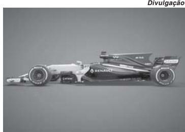
O novo Renault RS17 com a "barbatana de tubarão"

Como fã de automobilismo, confesso que fiquei um pouco desapontado com o visual dos carros que vi até agora. Não se trata de sau-