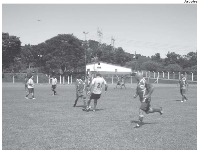
Caram levou a melhor no clássico contra o Seniors Clube Paraisense que de quebra perdeu a liderança do campeonato

Quem se deu bem e fez o dever de casa conquistando a terceira vitória consecutiva foi a equipe de Termópolis que venceu o Ouro Verde e saltou para a ponta da tabela agora com 10 pontos ganhos. Com um jogo a menos que o Senior's, o Caram ainda pode subir para a liderança no de-