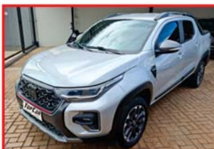
STRADA ULTRA - 2024 TURBO - AUTOMÁTICA