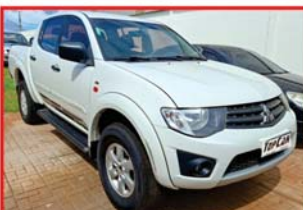
L200 TRITON - 2014 MANUAL - FLEX - 4X2