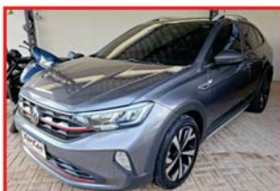
NIVUS HIGH TURBO - 2021 CINZA - AUTOMÁTICO