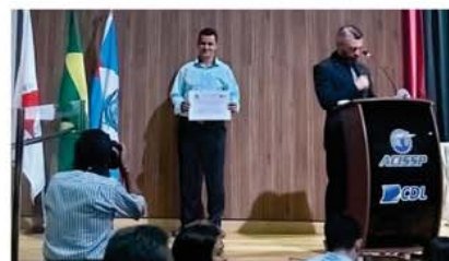
Homenagem recebida pela ACISSP (Associação Comercial, Industrial, Agropecuária e de Serviços de São Sebastião do Paraíso)