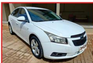
CRUZE LT - AUTOMÁTICO FLEX - BANCOS DE COURO 2014 - RETROVISOR ELÉTRICO