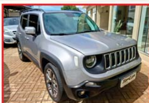
RENEGADE LONGITUDE - 1.8 2020 - FLEX - AUTOMÁTICO