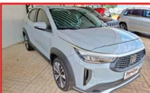
FASTBACK AUDACE - 2023 FLEX - AUTOMÁTICO TURBO 200 MANUAL E CHAVE CHAVE PRESENÇA