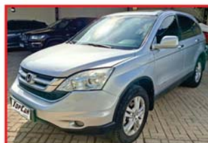
CRV 2010 - FLEX - PRATA TETO SOLAR - AUTOMÁTICO

AVENIDA ZEZÉ AMARAL, 75 - SÃO JOSÉ SÃO SEBASTIÃO DO PARAÍSO - MG