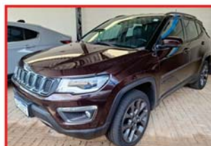
COMPASS S - 2019 DIESEL - 4X4 - START STOP