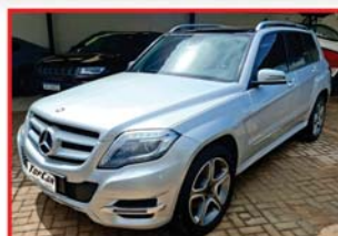
MERCEDES GLK 220 2014 - DIESEL - TETO SOLAR