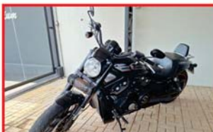
HARLEY DAVIDSON V-ROD 1250 CC NIGHT ROD SPECIAL - GASOLINA 2013 - CHAVE PRESENÇA - 45.912KM - MANUAL DO PROPRIETÁRIO