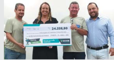
Projeto Projeto Mais Conforto e Segurança de Pratápolis – MG