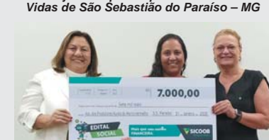
Projeto Ventiladores de São Sebastião do Paraíso – MG