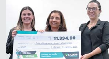
Projeto Aquisição de Tablets para Atendimento Terapêutico de Pessoas com Transtorno do Espectro Autista (TEA) de São Sebastião do Paraíso – MG