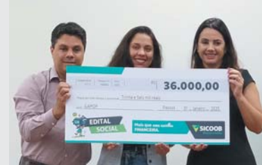
Projeto Alimentação para Pacientes Oncológicos de Passos – MG