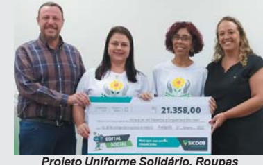
Projeto Uniforme Solidário, Roupas que Transformam de Pratápolis – MG