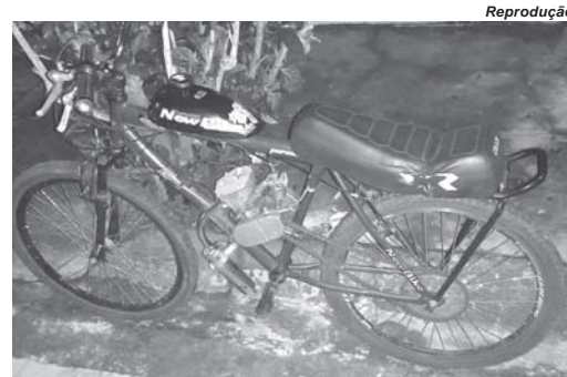
Bicicleta motorizada foi apreendida e levada para o pátio credenciado