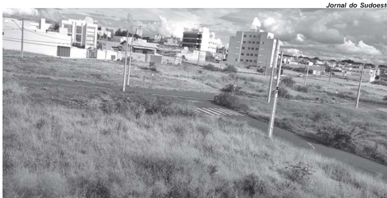
Vegetação alta em terrenos tem causado transtornos a moradores

Já uma moradora do Jardim de Versalhes pede para que o Poder Executivo tome providências. "Nós sabemos que a prefeitura pode mandar fazer a limpeza desses imóveis e, depois, multar o proprietário e cobrar pelo serviço. Queremos que isso seja feito, porque a situação está um caos", declara a moradora. Diante das reclamações, a