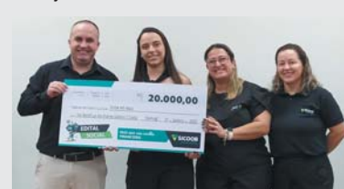
Projeto Fraldas Descartáveis de Itamogi – MG