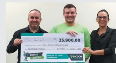
Projeto a Equoterapia Reabilitando Vidas de São Sebastião do Paraíso – MG