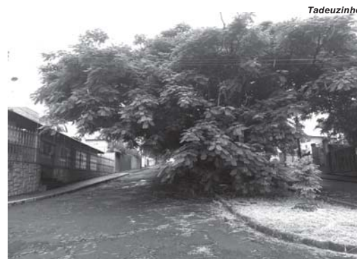
Na Rua Dr. Ronaldo Fróes, no Jardim das Paineiras, enormes árvores estão com os galhos quase alcançando o piso da rua e por questão de segurança, precisam ser podadas

Nesta época chuvosa, acontecem com maior frequência e provoca preocupações e mais cuidados, o aumento de buracos dentro da pavimentação asfáltica e nos calçamentos nas vias públicas do perímetro urbano e de rodovias, tanto de âmbito Federal, Estaduais e Municipais. Outra preocupação, principalmente no perímetro urbano, se trata do crescimento mais avantajado de árvores dentro das vias públicas e praças. Quanto aos buracos, a preocupação é que venham acontecer acidentes com veículos, condutores e passageiros. Sobre o aumento do tamanho das árvores, a preocupação é com temporais acompanhados de vendavais que podem derrubar árvores