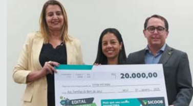
Projeto Capacitação Profissional para o Futuro de Jacuí – MG