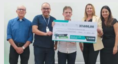
Projeto Cuidado Neonatal de Passos – MG

Projeto: Clima Ideal, Hidratação Essencial INSTITUIÇÃO: CHAME Centro de Integração Social, CIDADE: Itaipava de Minas – MG, VALOR: R$ 13.377,91 e RESUMO DO Projeto: Aquisição e instalação de ar-condicionado e bebedouro refrigerado para a instituição.