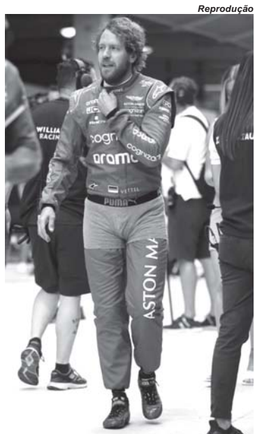
Sebastian Vettel vestiu a cueca sobre o macacão em protesto contra exigências do presidente da FIA no GP de Miami de 2022

mio local do ano passado, Verstappen foi obrigado a prestar serviços voluntários por ter proferido um palavrão que não foi direcionado a nenhuma pessoa, e sim como desabafo aos problemas enfrentados com o carro, e em São Paulo Charles Leclerc foi multado por ter falado "o carro estava uma m..." durante a coletiva de imprensa na corrida anterior, no México. Por fim, a GPDA cobrava explicações para onde ia o dinheiro das multas aplicadas aos pilotos.