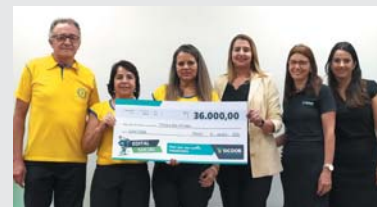
Projeto Combate à Fome de Passos – MG