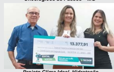
Projeto Clima Ideal, Hidratação Essencial de Itaipava de Minas – MG