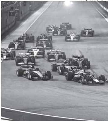
Largada do GP de Abu Dhabi com três pilotos com chances de título depois de 15 anos

Verstappen foi o grande nome da temporada. As vitórias no Japão e em Imola nos momentos mais críticos da falta de performance dos carros da Red Bull, atestam a qualidade excepcional do holandês. São nessas condições (quando não se tem o melhor carro), as melhores para avaliar a capacidade de um piloto. Verstappen foi quem mais fez pole positions (8) e venceu corridas no ano, também 8. Norris e Piastri venceram 7 cada um, mas Norris fez uma pole a mais que Piastri (7 a 6). Além deles, George Russell foi o outro piloto de