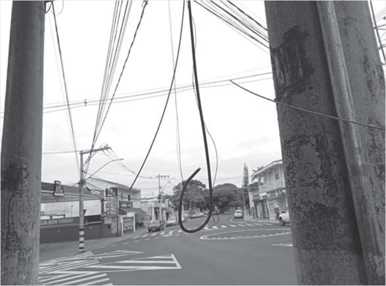
Na Av. Wenceslau Braz, Bairro Mocoquinha, fio solto oferecendo risco de acidente com pedestres