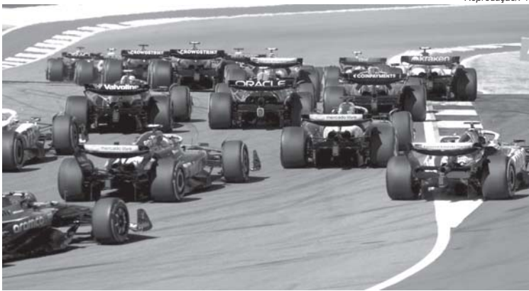
Muita competitividade também no pelotão de trás da F1 com grids apertados e disputas acirradas por pontos

O último ano do regulamento dos carros com efeito-solo aproximou as equipes de tal modo que nos leva a pensar, por que mudar as regras agora que ficou bom? Mas mudanças fazem parte do DNA da F1