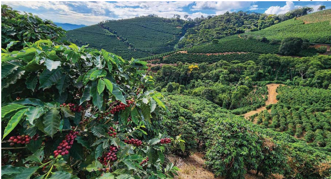
Projeção, calculada com dados de novembro, aponta crescimento de 13,8% em relação a 2024, puxado pelo bom desempenho do café