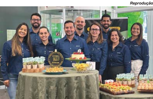
Sicredi comemorou nesta segunda-feira, 22/12, seu aniversário de 6 anos em São Sebastião do Paraíso

Presente em todo território nacional, o Sicredi é a primeira instituição financeira cooperativa do Brasil,