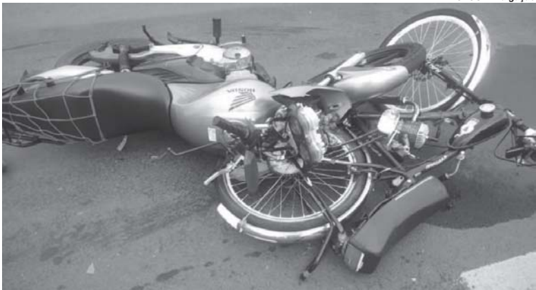
Moto e bicicleta das vítimas ficaram parcialmente destruídas após a colisão

do encaminhado às pressas para a Santa Casa de Misericórdia, onde o óbito foi constatado. O motociclista foi levado à Unidade de Pronto Atendimento (UPA), com