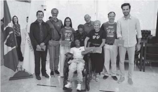
Guia Prático - Direitos, Benefícios e Serviços para Pessoa com Deficiência também deve ser conhecido por outros grupos da sociedade

Conforme o parlamentar, nesta Legislatura foram apresentadas cerca de 250 propostas de lei relacionadas ao seg-