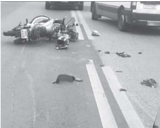
Acidente ocorreu no meio da pista da avenida Washington Martoni, perto da rodoviária