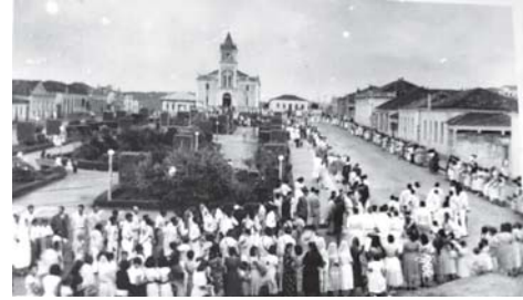
JACUHY Praça Presidente Vargas

O ontem: Jacuhy (A Força da Província). No século XIX e início do XX, o "h" e o "y" não eram apenas letras; representavam o status da Vila de São Carlos do Jacuhy. Era o centro administrativo e comercial de uma região vasta, por onde passavam os tropeiros e a elite cafeeira. Falar de Jacuhy é evocar a imagem de uma cidade que foi "mãe" de várias outras no Sudoeste Mineiro, com sua arquitetura colonial imponente e a força da extração de "ouro" e da agropecuária original.