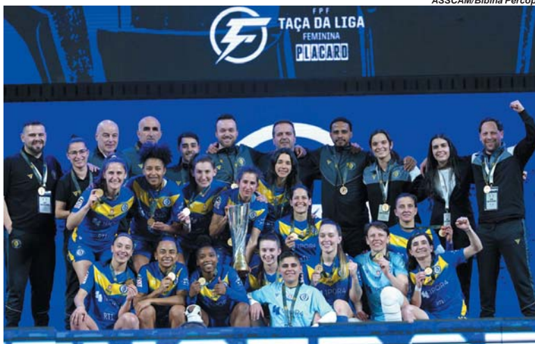
Elenco do GCR Nun'Álvares celebra a conquista da Taça da Liga Feminina de Futsal 2025/2026, após vitória nos pênaltis sobre o Benfica, em Portugal

Ela também destacou que o Nun'Álvares segue competitivo no restante do calendário. "A temporada tem sido muito boa. A gente está em segundo no campeonato