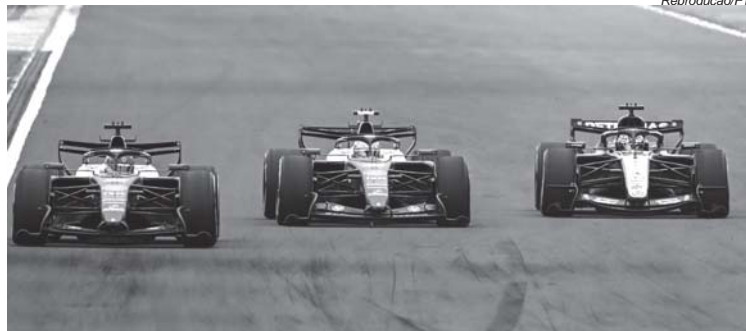
As corridas tem sido boas, mas é preciso ajustes no regulamento para as ultrapassagens ficarem menos artificiais

O GP da China foi uma corrida animada com disputas intensas e muitas ultrapassagens, mas até que ponto o novo regulamento está fazendo bem ou mal para a própria categoria?