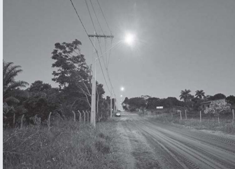
Com os padrões prontos, dezenas de famílias que residem no Lot. Recanto Feliz, não tem energia elétrica em suas residências