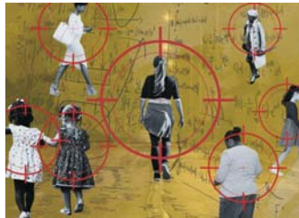
Colagem Erro de matemática

Madrugada. Uma pessoa de sessenta anos volta para casa a pé. As ruas estão desertas, alguns trechos pouco iluminados, outros com terrenos baldios. Um cenário que inspira tensão em muita gente, mas essa pessoa aqui tem sessenta anos. Já não se preocupa tanto como antes. A idade vai borramento o alvo, não? Errado. O alvo continua ali porque essa pessoa é uma mulher. Aos 15, 30, 60, 80 habitar esse corpo significa carregar o alvo. Uma mulher nunca está segura.