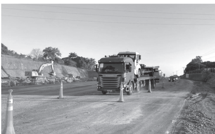
Por Ralph Diniz

Durante as obras, trânsito será desviado na altura do KM 46 da rodovia. Cobrança de tarifa está prevista para começar em outubro